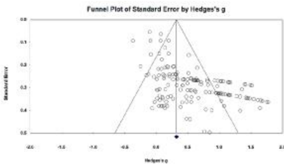
نمودار 3. نمودار کیفی اندازه اثرهای 24 پژوهش (پس از حذف اندازه اثرهای پرت)

کنار گذاشته شدند و دوباره نمودار کیفی ارائه شد (نمودار کیفی شماره 3). با توجه به اینکه هدف اصلی هر فراتحلیل، ترکیب