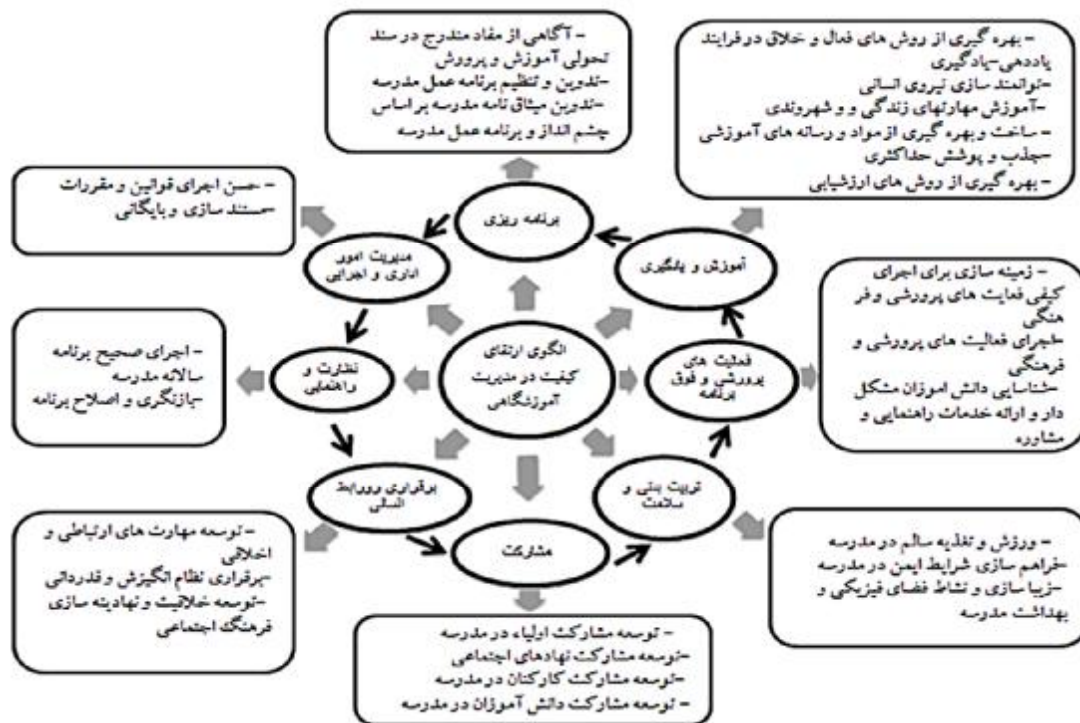
نمودار 1. الگوی نهایی ارتقای کیفیت مدیریت آموزشگاهی در مدارس ابتدایی استان زنجان